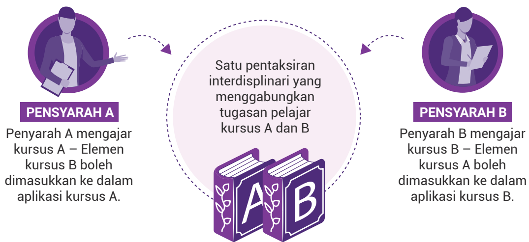
Rajah 4.3: Pelaksanaan pengajaran Kolaboratif pilihan Model 3

Seterusnya Model 3 menggambarkan kolaborasi yang menggunakan model 3 dan pentaksiran interdisplinari seperti yang ditunjukkan pada Rajah 4.3.